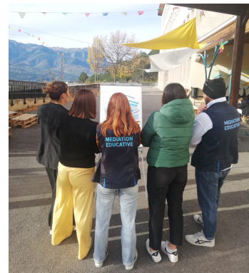
Présentation du service médiation socio-éducative au lycée Honorée Romane à Embrun

Tout au long de l'année scolaire, l'équipe est présente à l'intérieur des lycées, à travers des actions en cohérence avec le choix du lycée et permettant de rencontrer un plus grand nombre de jeunes.