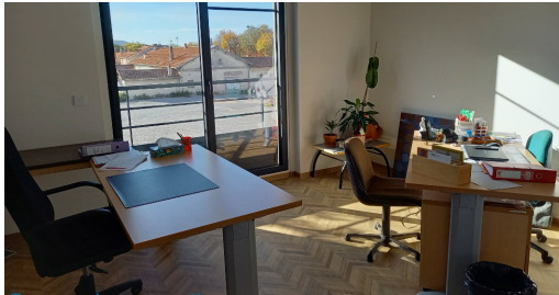
Bureau des travailleurs sociaux