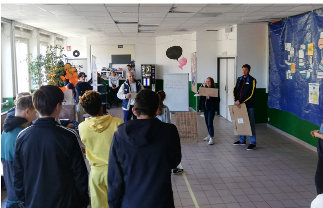
Débat mouvant le au lycée d'altitude d'Embrun le 10 novembre 22