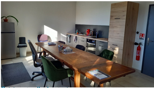
Luisine et salle de réunion