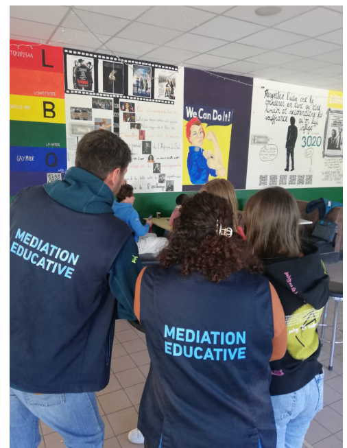
Débat mouvant au lycée d'altitude d'Embrun le 10 novembre 22