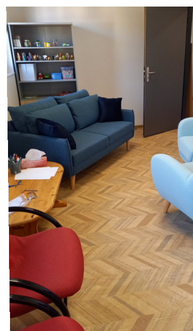
Bureau de la psychologue