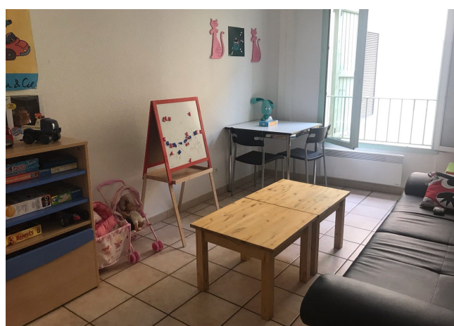
Après début juillet