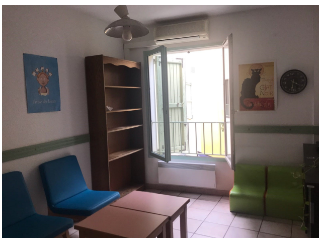
Avant début juillet

Début juillet, petite avancée concernant les restrictions sanitaires : les jeux sont à nouveau accessibles pour les visites dans l'espace rencontre.